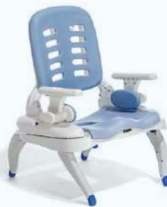
Base per la vasca da bagno