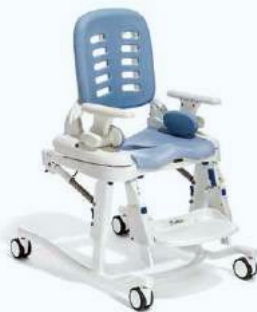
Base a ruote